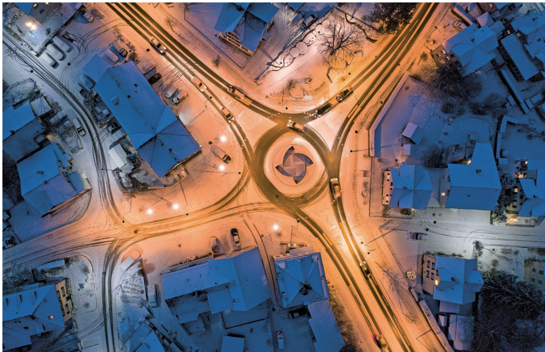
Bildform Henau, Peter Dotzauer

14'457 Menschen wohnten Ende 2025 in der Gemeinde. Das sind 92 mehr als ein Jahr zuvor. Diese Zahlen sagen wenig aus über die Wanderungsbewegungen der Bevölkerung. Und die sind ausgeprägt.