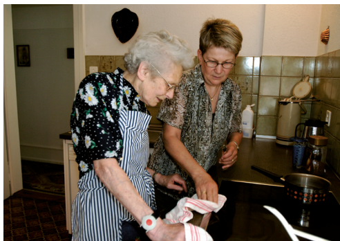
Pro Senectute Wil &amp; Toggenburg

Die Pro Senectute sucht Mitarbeiterinnen und Mitarbeiter, die sich zum Wohl unserer Senioren und Seniorinnen der Gemeinde Uzwil einsetzen wollen, sei es bei der Unterstützung im Wochenkehr, beim Waschen, Kochen, Einkaufen oder Betreuen und Entlasten von Angehörigen. Die Einsätze sind entschädigt, es handelt sich aber nicht um eine existenzsichernde Anstellung.