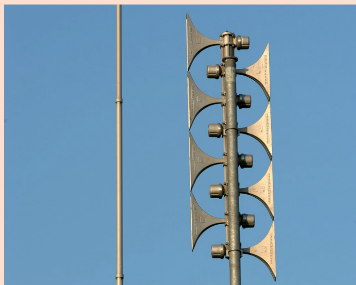
Bundesamt für Bevölkerungsschutz BABS

Für einen optimalen Schutz braucht neben funktionierenden Sirenen auch das richtige Verhalten bei einem «echten» Sirenenalarm. Heulen die Sirenen ausserhalb eines angekündigten Tests, ist eine Gefährdung der Bevölkerung möglich. In diesem Fall ist die Bevölkerung aufgefordert, Radio zu hören, die Anweisungen der Behörden zu befolgen und die Nachbarn zu informieren.