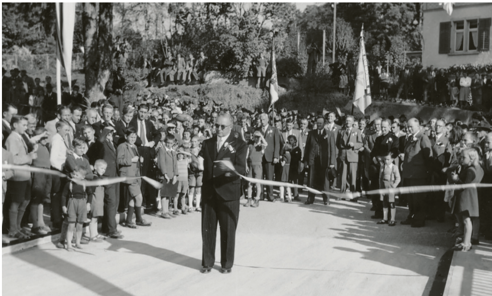
So wurde 1947 die Brübacher Brücke eingeweiht. Viel Volk, Fahnen, ein durchschnittenes Band, ein Regierungsrat in Aktion.

Brückeneinweihungen waren in der Vergangenheit aussergewöhnliche Momente. Im Bild unten durchschneidet Regierungsrat Kessler am 5. Oktober 1947 das Band zur Einweihung der damals neuen Brübacher Brücke. Am Anlass gab es nicht weniger als vier Festansprachen.