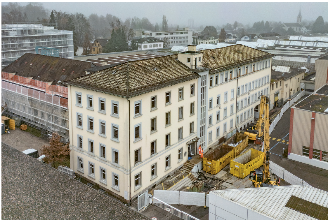
Das ehemalige Bürohaus an der Fabrikstrasse weicht einem Neubau. Parallel laufen die Sanierungsarbeiten am «Blauen Engel» links im Bildhintergrund.

Eingebettet zwischen Niederuzwil und Uzwil entwickelt und produziert der Technologiestandort für die Welt. Mit dem Projekt «Mahlwerk» wird ein Teil des Areals umgenutzt und in die Zukunft geführt. Sichtbar sind die Arbeiten am «Blauen Engel», ein anderes Bürogebäude wird zurückgebaut und macht Platz für Neues.