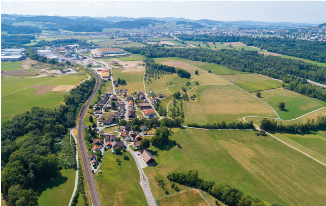
Beat Schiltknecht, Flawil

150 der fast 14'000 Einwohnerinnen und Einwohner der Gemeinde leben im Dorf Niederstetten. Der Schutz des Dorfes vor Durchgangsverkehr ist seit Jahren wichtiges Thema. Fürs Dorf und für die Gemeinde. Schritte sind im konstruktiven Dialog mit dem Dorf umgesetzt, weitere folgen.