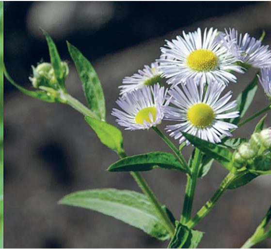
Drüsiges Springkraut und einjähriges Berufkraut – zwei der am häufigsten anzutreffenden Neophyten. Damit es ihnen an den Kragen geht, braucht es den Einsatz aller. Auch Sie können mithelfen!

Neophyten sind Pflanzenarten, die hier nicht heimisch sind, die aber beabsichtigt oder unbeabsichtigt zu uns gelangt. Die meisten dieser Arten verschwinden schnell wieder oder fügen sich problemlos in die Pflanzenwelt ein. Einige aber verbreiten sich stark und setzen sich hartnäckig durch. Sie verhalten sich invasiv und werden zum Problem.