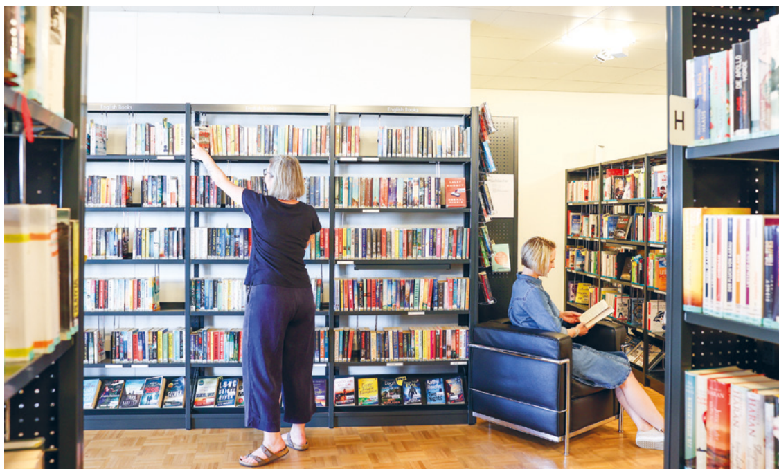
Bilderwerk gmbh, Uzwil

Im August 1998 eröffnete die Uzwiler Gemeindebibliothek ihre Türen. Nicht ganz freiwillig und in einem finanziell schwierigen Moment. Jetzt, 25 Jahre später, schaut die Kultureinrichtung auf eine freudige Erfolgsgeschichte zurück - und zuversichtlich in die Zukunft. Ihre Zukunft beginnt die Bibliothek mit einer ganzen Reihe von Veranstaltungen zum Jubiläum.