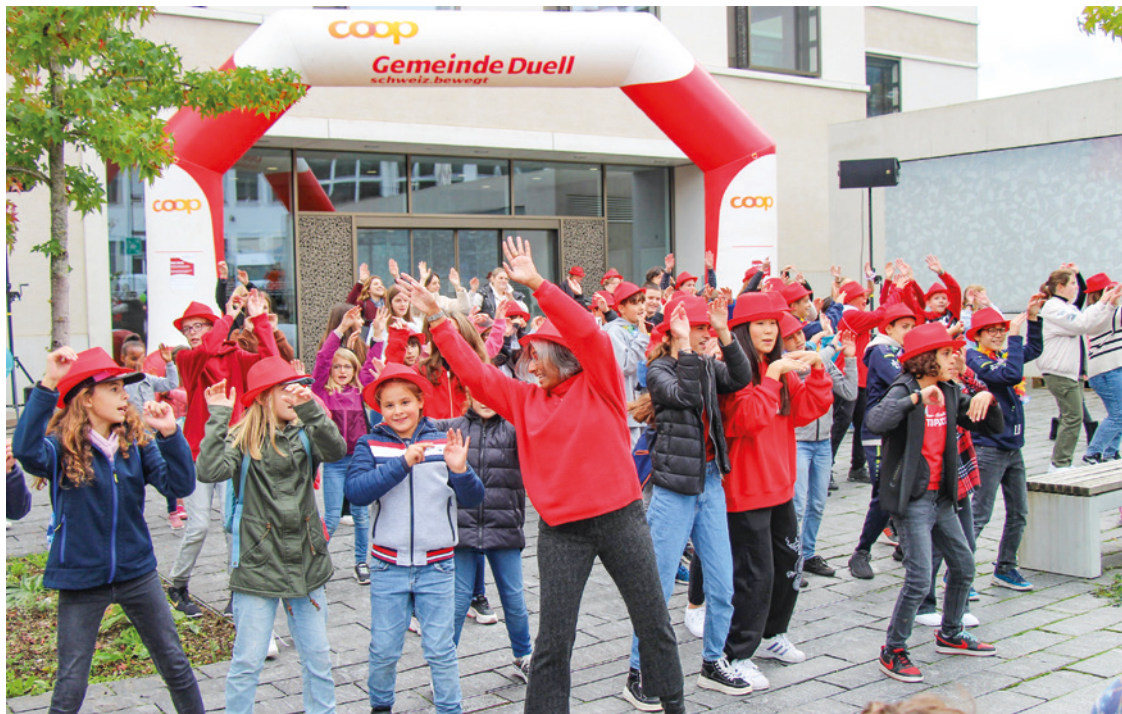
Der Bewegungstanz am Uzwiler Herbstmarkt mit vielen Schülerinnen und Schülern und dem Projektteam war der Auftakt zu «oberUZWIL bewegt Mai 2023».

Das «Coop Gemeinde Duell» von «schweiz.bewegt» ist das nationale Programm für mehr Bewegung und gesunde Ernährung. Die Gemeinden Uzwil und Oberuzwil sammeln im Mai 2023 gemeinsam Bewegungsminuten und treten im nationalen Vergleich gegen andere Gemeinden an. Im Zentrum stehen die sportliche Aktivität, die Gesundheit und der Spass.